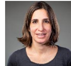
Wenger Coralie, Syndicom Fotografin Basadingen, 11.22